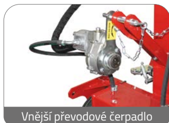
Vnější převodové čerpadlo