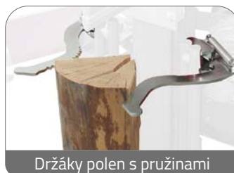
Držáky polen s pružinami