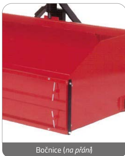
Bočnice (na přání)

Speciálně navržený otočný bod pro maximální robustnost