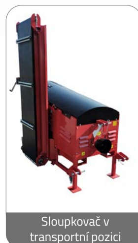
Sloupkovač v transportní pozici