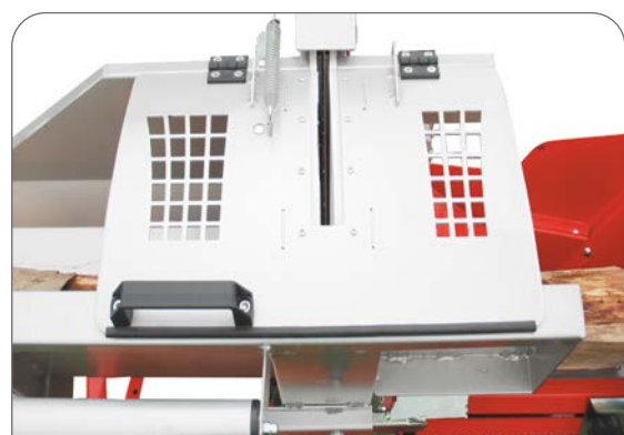
Bezpečnostní kryt kolébky