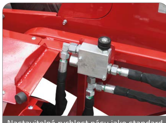
Nastavitelná rychlost pásu jako standard