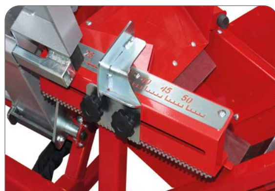
Délka řezu 20-50 cm