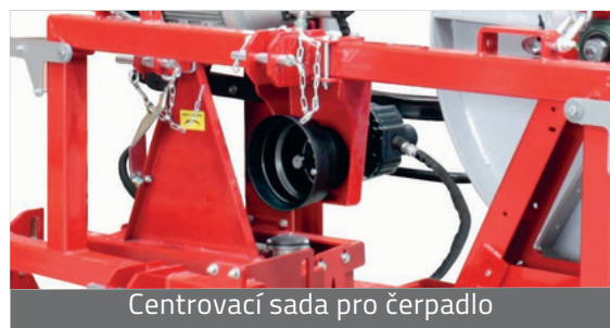
Centrovací sada pro čerpadlo