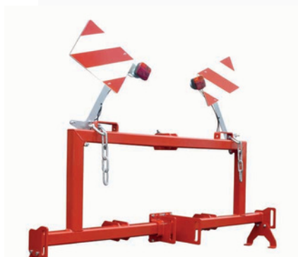
Spojovací rám SIFF, bez baličky a štípače*